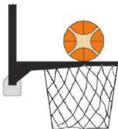
Diagrama 3 Balón en contacto con el aro

31-20 Afirmación: Es una violación de interferencia si un defensor o un atacante, durante un tiro, toca la canasta (aro o red) o el tablero mientras el balón está en contacto con el aro y aún tiene posibilidad de entrar en la canasta.