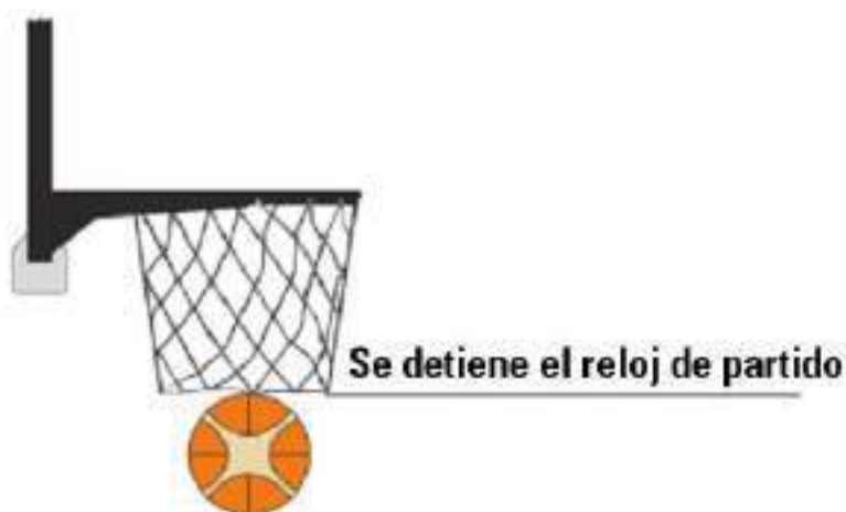
Diagrama 2. Tiro convertido

16-15 Ejemplo: Cuando quedan 2:02 para el final del último cuarto, A1 consigue una canasta al atravesar el balón el cesto. Cuando quedan 2:00, B1 está preparado para sacar detrás de la línea de fondo.